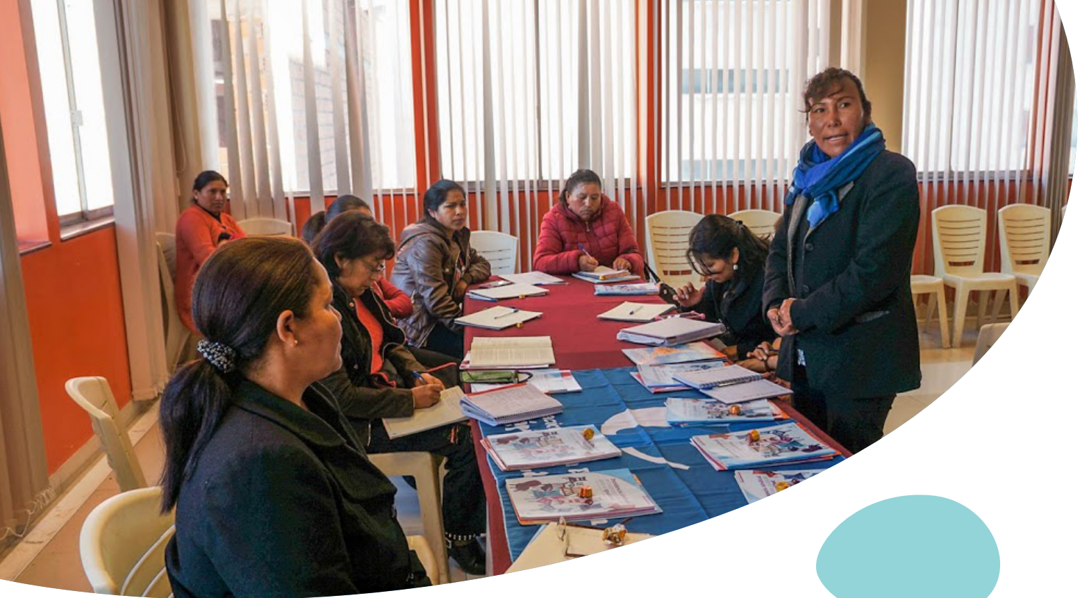
▲ Compañeras de CONMERB y CTEUB en sesión de grupo focal en La Paz, marzo 2017.

Se ha observado una apropiación desigual en cuanto al contenido y el ejercicio de las políticas públicas que son beneficiosas para las mujeres. En algunas regiones y departamentos, las compañeras de los sindicatos han incluido las legislaciones sobre violencia y sobre protección de la lactancia en los espacios sindicales; en otros, no lo han hecho.