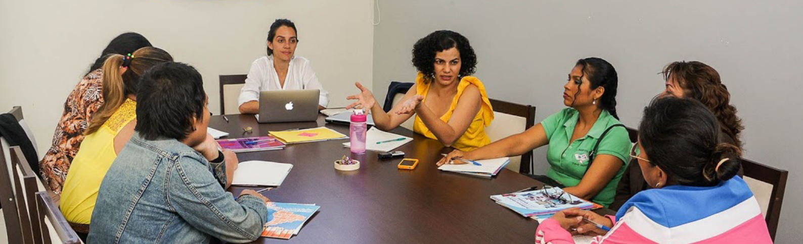
▲ Compañeras de CONMERB y CTEUB en sesión de grupo focal en Santa Cruz de la Sierra, Marzo 2017.