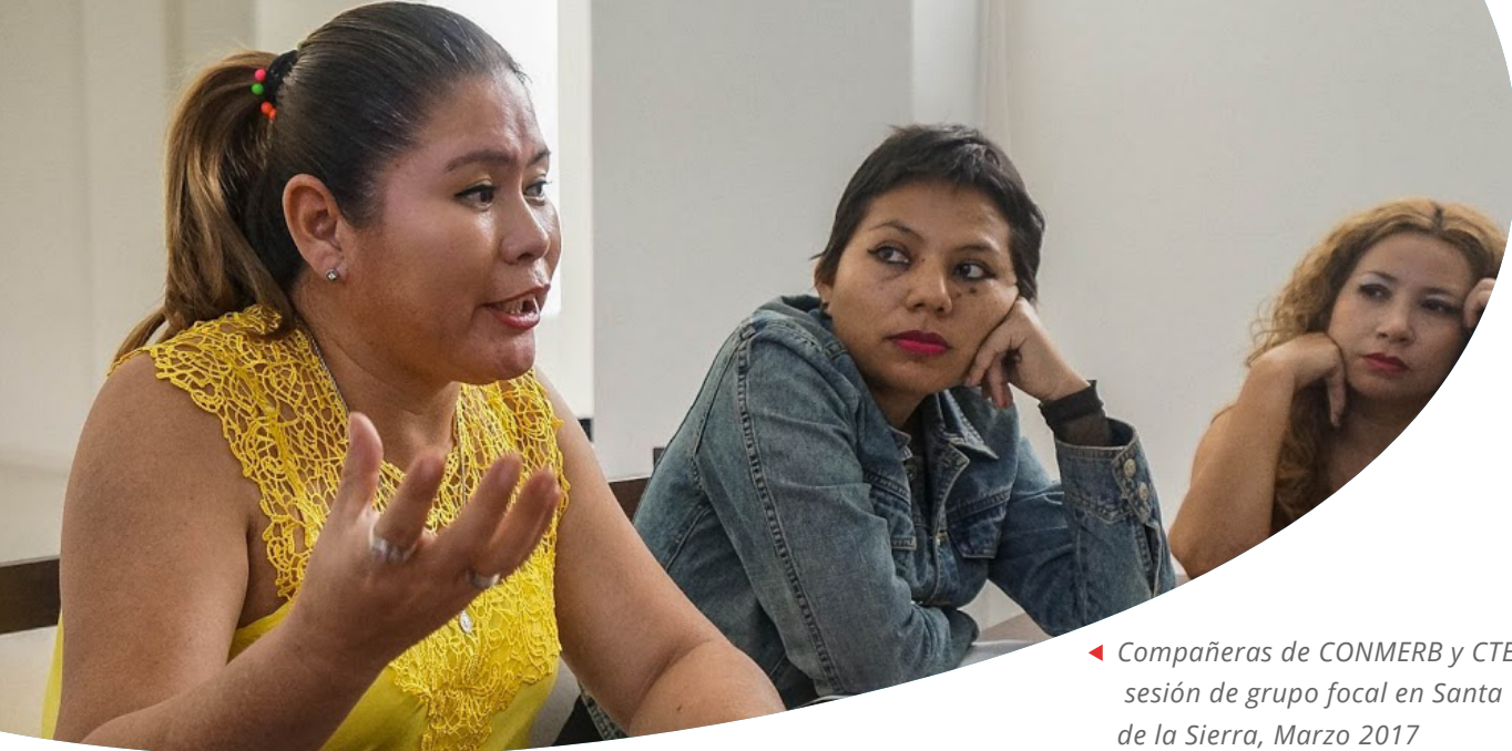
◀ Compañeras de CONMERB y CTEUB en sesión de grupo focal en Santa Cruz de la Sierra, Marzo 2017

Por su parte, el magisterio está preocupado por el alto nivel de participación de los sectores indígenas y campesinos en la toma de decisiones en materia educativa. A pesar de esta preocupación, las dirigentas de CONMERB y CTEUB no indicaron haber desarrollado una propuesta de política educativa para presentar en estos espacios de toma de decisiones.